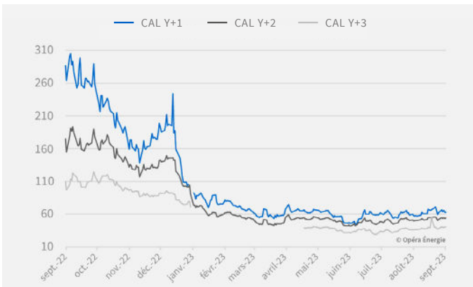
EVOLUTION DES PRIX DU GAZ DEPUIS 1 AN (en €/MWh)

Attention : le changement d'année de livraison exagère l'effet baissier de décembre 2022 à janvier 2023.