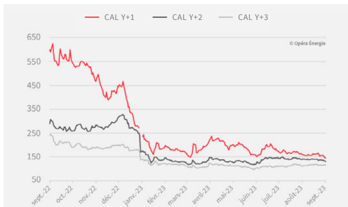
EVOLUTION DES PRIX DE L'ÉLECTRICITÉ DEPUIS 1 AN (en €/MWh)

Attention : le changement d'année de livraison exagère l'effet baissier de décembre 2022 à janvier 2023.