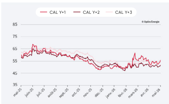
Évolution des prix de l'électricité depuis 1 an (en €/mwh)

Attention : le changement d'année de livraison exagère l'effet baissier de décembre 2025 à janvier 2026.