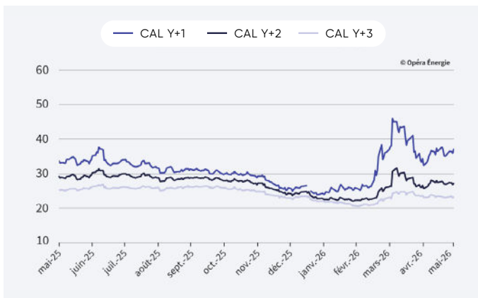
Évolution des prix du gaz depuis 1 an (en €/MWh)

Attention : le changement d'année de livraison exagère l'effet baissier de décembre 2025 à janvier 2026.