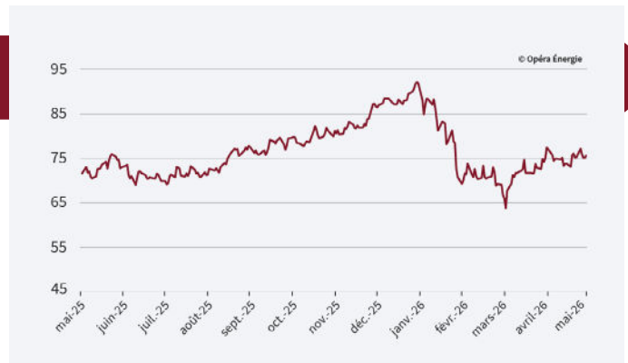
Évolution des prix du carbone depuis 1 an (en €/MWh)

Le prix reste stable avec un prix entre 73 et 77€/t depuis maintenant 1 mois. Le marché reste dans l'attente de la décision de la Commission européenne sur la révision du système le 15 juillet.