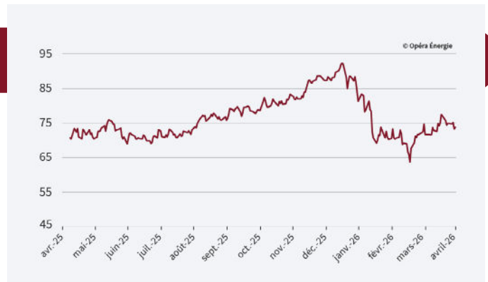
Évolution des prix du carbone depuis 1 an (en €/MWh)

La demande en quotas de CO 2 demeure contenue . La production renouvelable élevée en Europe, notamment solaire et éolienne, restreint le recours aux énergies fossiles. Dans ce contexte, les prix se stabilisent autour de 73 €/t , malgré un environnement géopolitique incertain.