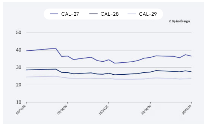
Évolution des prix du gaz sur le dernier mois (en €/MWh)

Attention : le changement d'année de livraison exagère l'effet baissier de décembre 2025 à janvier 2026.