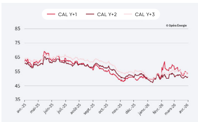
Évolution des prix de l'électricité depuis 1 an (en €/mwh)

Attention : le changement d'année de livraison exagère l'effet baissier de décembre 2025 à janvier 2026.