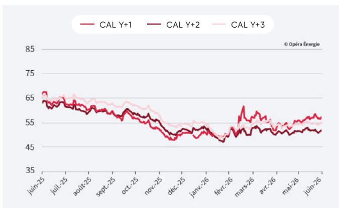
Évolution des prix de l'électricité depuis 1 an (en €/mwh)

Attention : le changement d'année de livraison exagère l'effet baissier de décembre 2025 à janvier 2026.