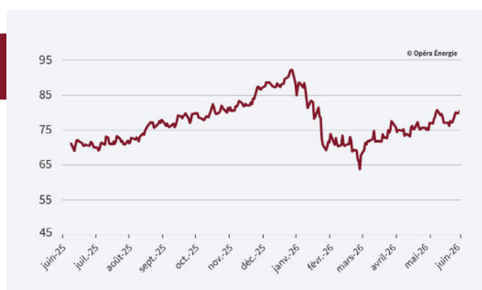
Évolution des prix du carbone depuis 1 an (en €/MWh)

Les prix du carbone demeurent orientés à la hausse . Le marché continue d'intégrer les perspectives d'une réforme du système européen d'échange de quotas d'émission (EU ETS), avec un possible resserrement de l'offre de quotas dans les années à venir . Les anticipations d'une demande plus élevée, liée aux besoins de climatisation , contribuent également à maintenir les cours à des niveaux élevés .