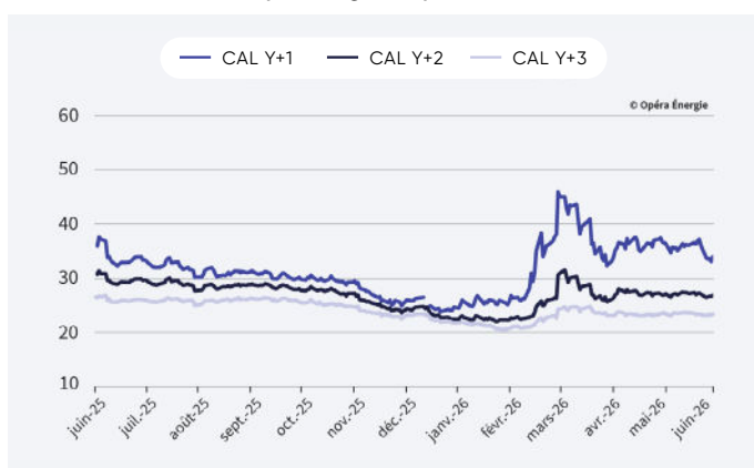
Évolution des prix du gaz depuis 1 an (en €/MWh)

Attention : le changement d'année de livraison exagère l'effet baissier de décembre 2025 à janvier 2026.