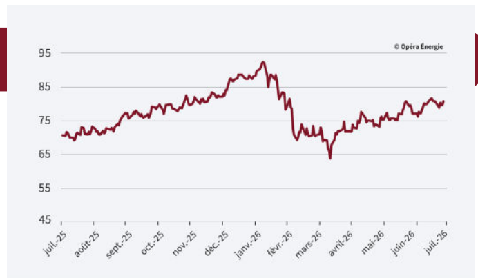
Évolution des prix du carbone depuis 1 an (en €/MWh)

Les variations demeurent limitées sur le marché des quotas d'émission de CO 2 , avec des prix qui évoluent autour de 80 €/t. Le retour d'une production renouvelable plus soutenue, notamment éolienne, a contribué à assouplir les fondamentaux du marché .