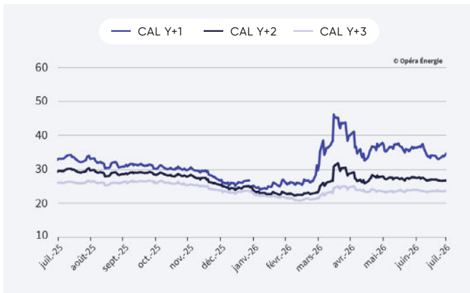
Évolution des prix du gaz depuis 1 an (en €/MWh)

Attention : le changement d'année de livraison exagère l'effet baissier de décembre 2025 à janvier 2026.